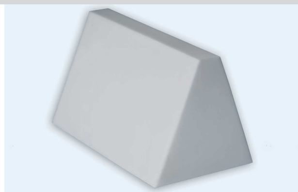
soni TRAPEZ šedivý. Dostupný také v bílé barvě.

*Basotect® je registrovaná značka BASF SE